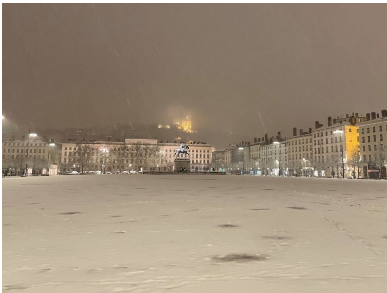
La neige est tombée à Lyon en janvier 2021.

Après une année 2020 marquée par les pics de chaleur, sécheresses et incendies, les pays de l'hémisphère Nord ont connu, en ce début d'année 2021, des températures particulièrement basses. Si, pour certains, cela semble être une occasion de remettre en question le changement climatique, il n'en est rien ! Cette vague de froid ne serait qu'une conséquence du changement climatique. Quel impact pour nos bâtiments ?